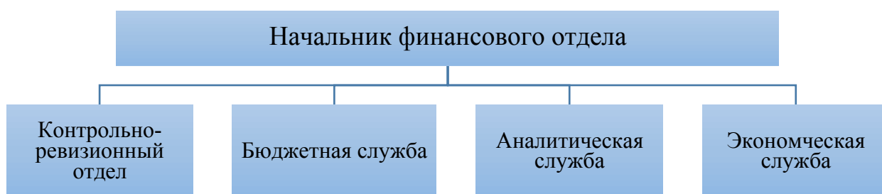
Рисунок 2. Организационная структура финансового отдела

Контрольно-ревизионная служба выполняет контроль текущих платежей, выполняет функции внутреннего аудита компании. Привлекает любую необходимую информацию от всех необходимых подразделений. Производит контроль подразделений касательно финансово-бухгалтерской и товарно-распорядительной документации. Тесно взаимодействует с бухгалтерией и ведет смежные участки работ с бюджетным и аналитическим отделами. Производит планово-фактический и «альтернативный» анализ. Предоставляет отчеты Руководству по необходимой корректировке финансово-хозяйственной деятельности.